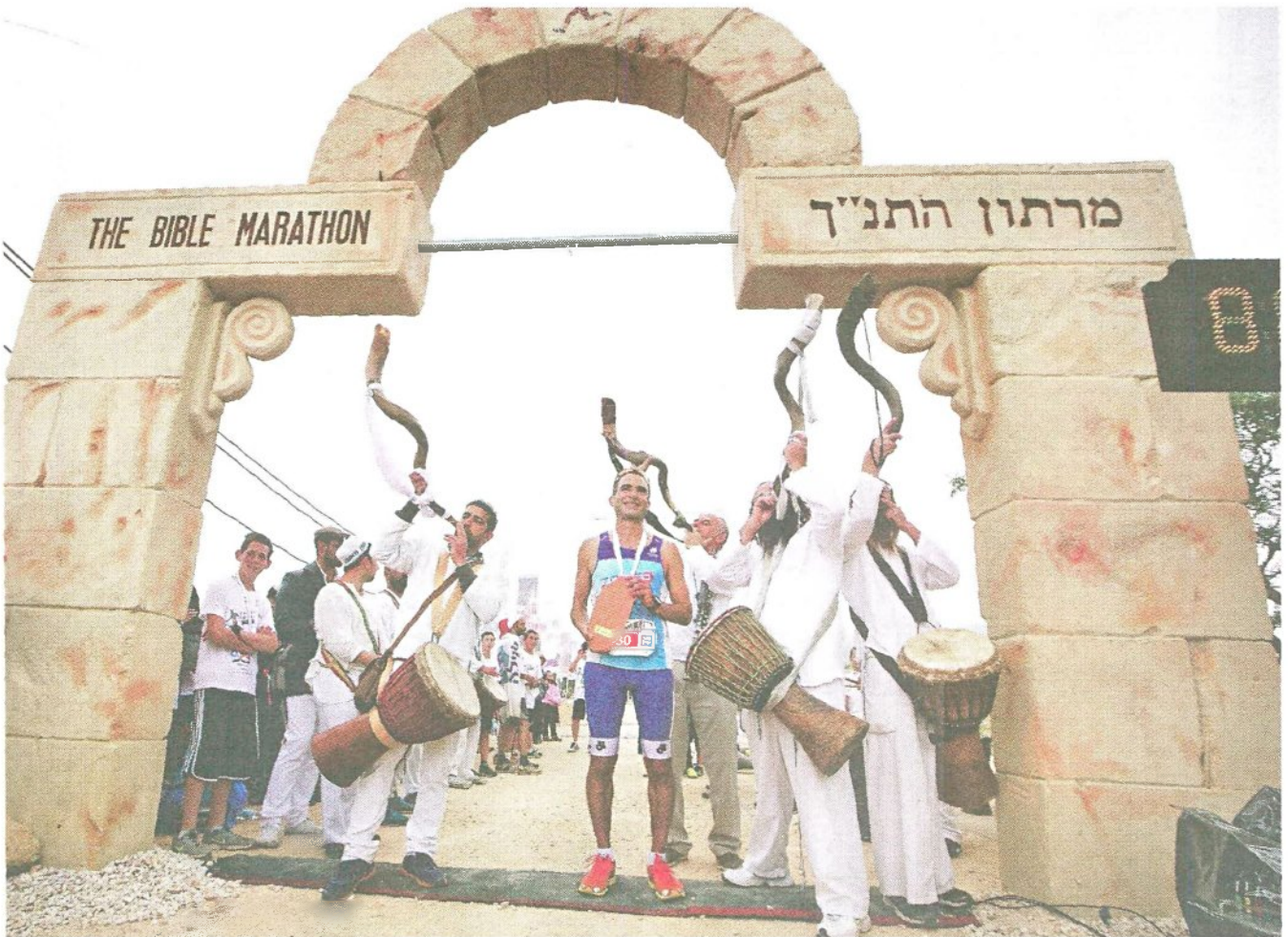
מראש העין לשילה הקדומה. מרתון התנ"ך